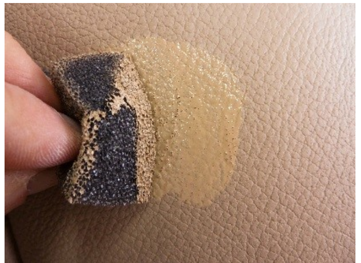
Rafraîchir la couleur avec la coloration Leather Fresh COLOURLOCK.

Vous pouvez protéger vos cuirs et similicuir de décolorations futures en scellant régulièrement la surface en cuir avec le scellement COLOURLOCK et les surfaces en similicuir avec la lotion protectrice pour similicuir . Ces produits réduisent la migration des colorants dans le cuir ou le similicuir. Veillez à appliquer le scellement sur la surface complète du cuir préalablement nettoyée pour que la protection soit efficace partout.