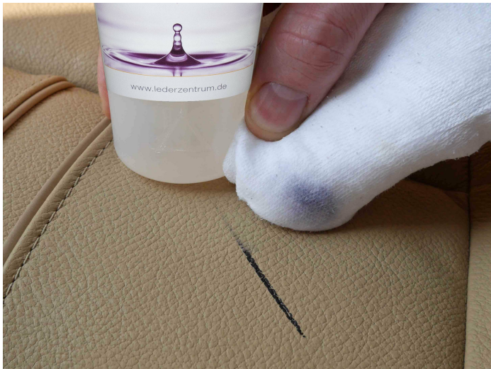
Le GLD fonctionne quand d'autres nettoyants classiques échouent.